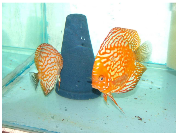
Figura 1. Casal de Symphysodon discus .

N° PB: número de parasitos em um arco branquial.